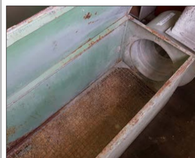
Hightech-Filter aus Holzwolke