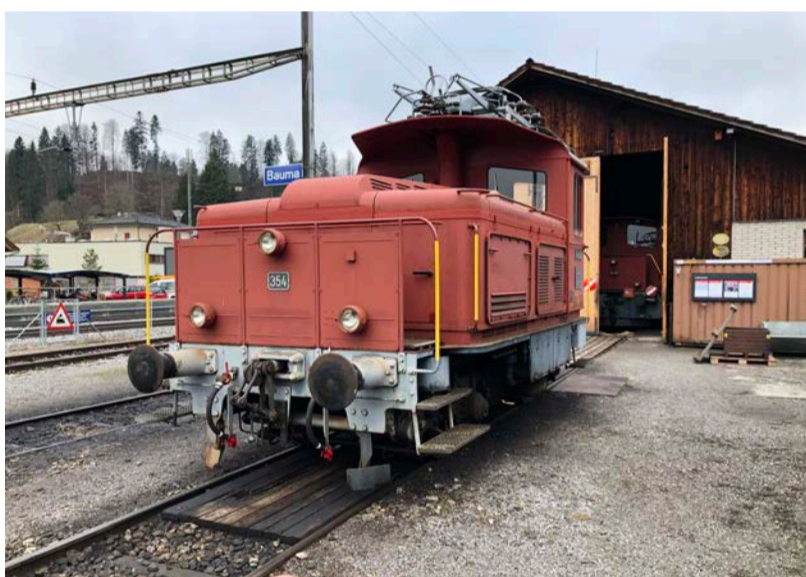
Der Tem III 354 vor dem Depot Bauma