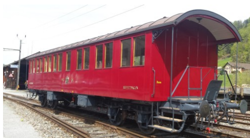
Aussenansicht des Wagens