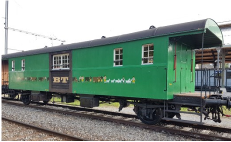
Aussenansicht des Wagens