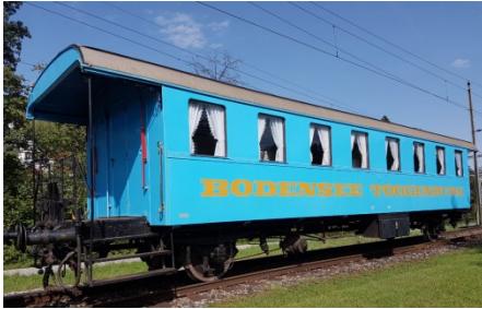
Aussenansicht des Wagens